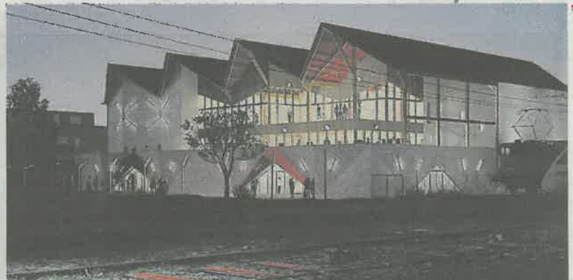
Le bâtiment coûtera 7 millions d'euros, dont 4,4 millions à la charge de La Roche-sur-Yon Agglomération.