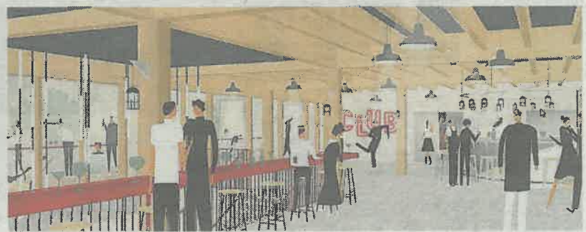
Au premier niveau, on découvre Le Club, et le bar qui donne sur une terrasse.