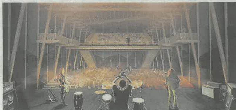
La grande salle de 800 places laisse apparaître une charpente en bois.