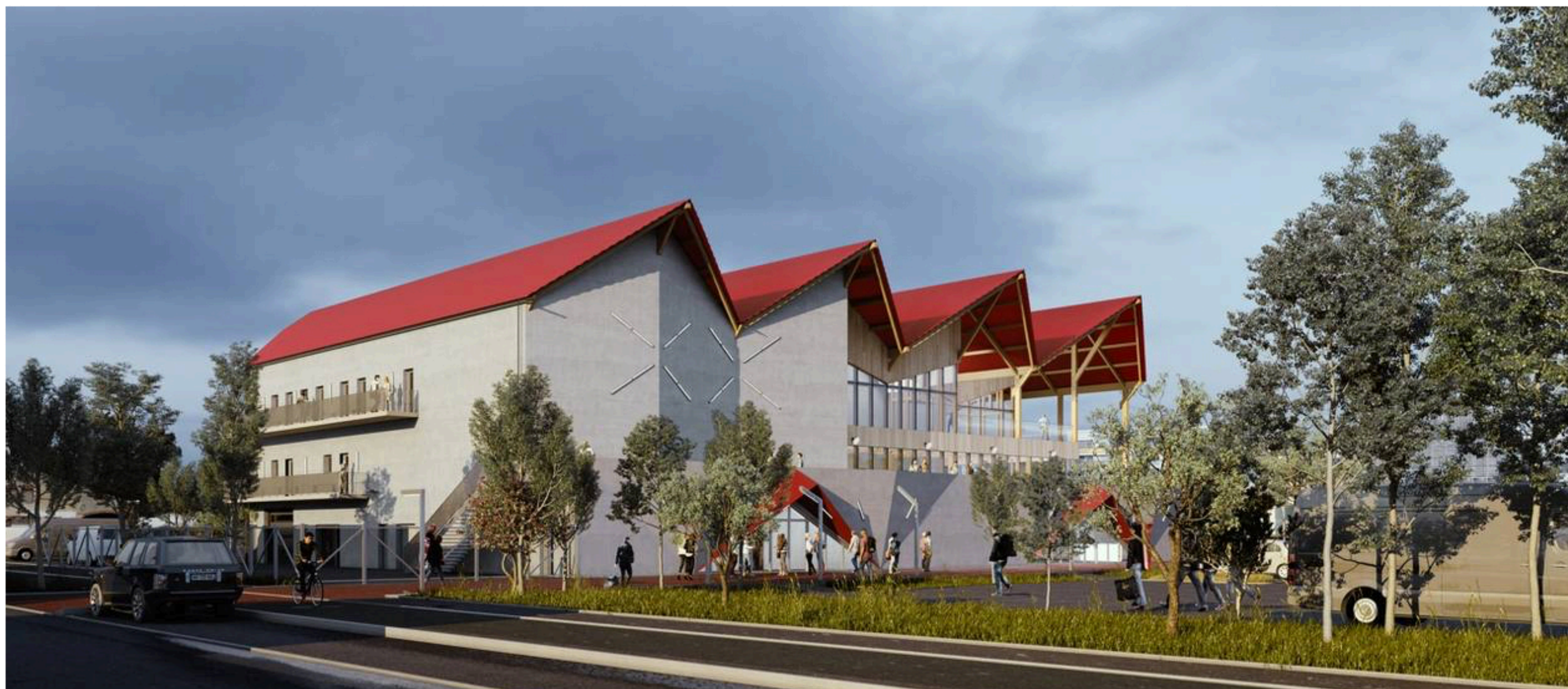
Le visuel de l'extérieur du bâtiment de la future salle de musiques actuelles. | ARCHITECTURE : CHLOÉ BODART-CONSTRUIRE